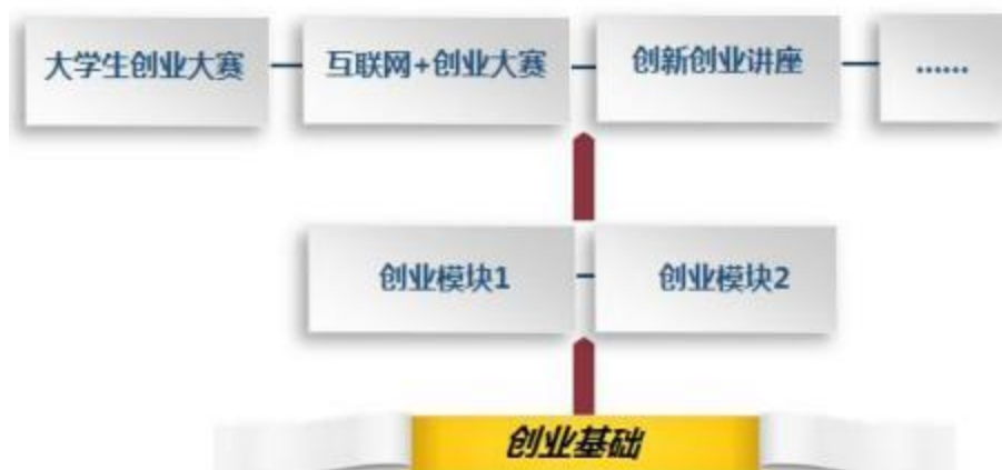
图3 创新创业课程体系建设思路

家开展专题训练，指导学生创新创业活动，促进创新创业的实践教学。其次，可以按照创业活动项目和特定的活动方式，开发创业沙盘、教学游戏和教学案例库，通过现实或模拟的创业实践活动，利用与专业相关的实践平台，利用虚拟的训练或虚拟创业公司，让学生身临其境地感触和体验创业的全部业务流程。创新创业实践课模块安排在第3-5学期，让学生在结合所学的专业基础上来领悟创新创业知识，提高创新创业能力。